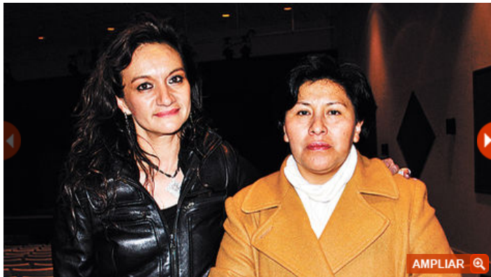
Segundo Festival Bolivia Clásica

Grandes maestros compartieron su talento y conocimientos con el público boliviano